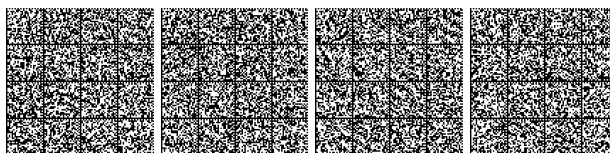
Tabella V.7-3: Livello di prestazione per controllo dell'incendio